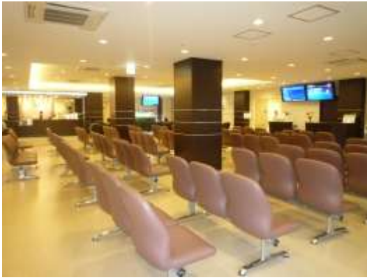
▲新待合室 今までより広く、 明るくなりました。