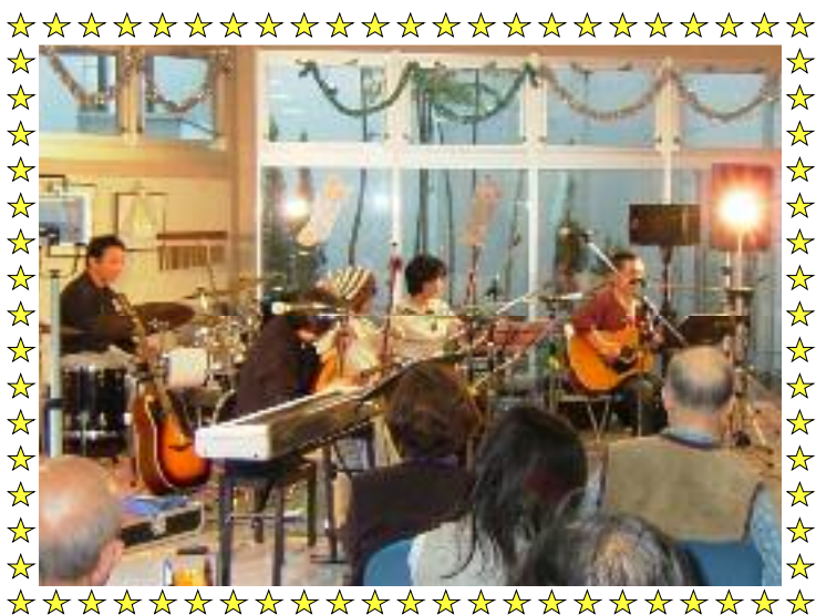
クリスマス音楽ライブの様子

編集後記 今年もスタートしました。飲みすぎ、食べすぎで体調を崩していませんか。インフルエンザも流行ってきているので、十分、体調管理に注意していきましょう。