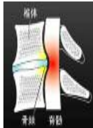
頸椎椎間板ヘルニアMRI